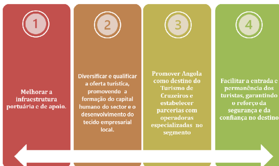
FIGURA 2 — Objectivos Específicos das Medidas para o Desenvolvimento do Turismo Marítimo

23. O conjunto de objectivos específicos revela a articulação entre as Medidas para o Desenvolvimento do Segmento de Turismo Marítimo e os demais instrumentos de política para o desenvolvimento do Sector do Turismo, apresentados na figura 2, nomeadamente no que concerne: