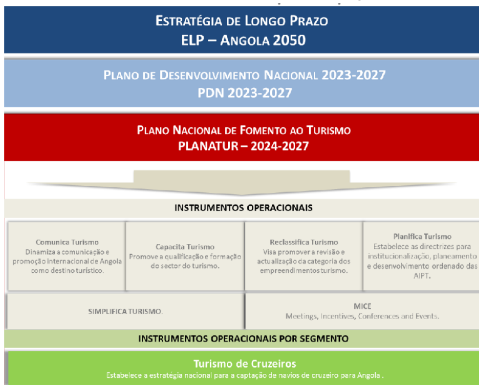
FIGURA 1 — Instrumentos Fundamentais de Política para o Sector do Turismo

20. Estas metas são o referencial para as Medidas para o Desenvolvimento do Segmento do Turismo Marítimo, integrando assim o conjunto de instrumentos operacionais por segmento que consubstanciam as medidas fundamentais de política para o desenvolvimento do Turismo em Angola (cuja visão integrada é representada na figura seguinte).