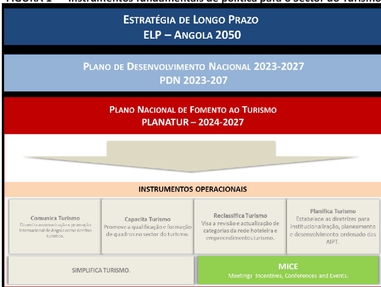
FIGURA 1 — Instrumentos fundamentais de política para o Sector do Turismo