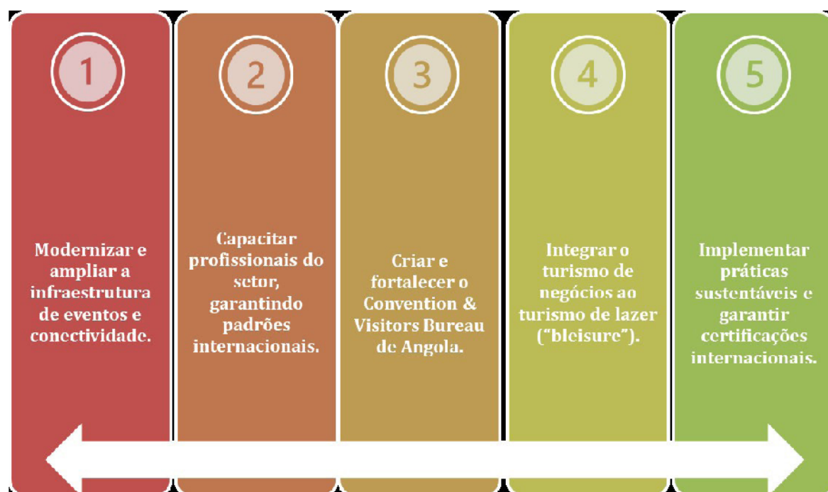
Figura 2 — Objectivos Específicos do MICE-Angola

40. A figura seguinte apresenta os objectivos específicos da estratégia de desenvolvimento do segmento MICE em Angola.