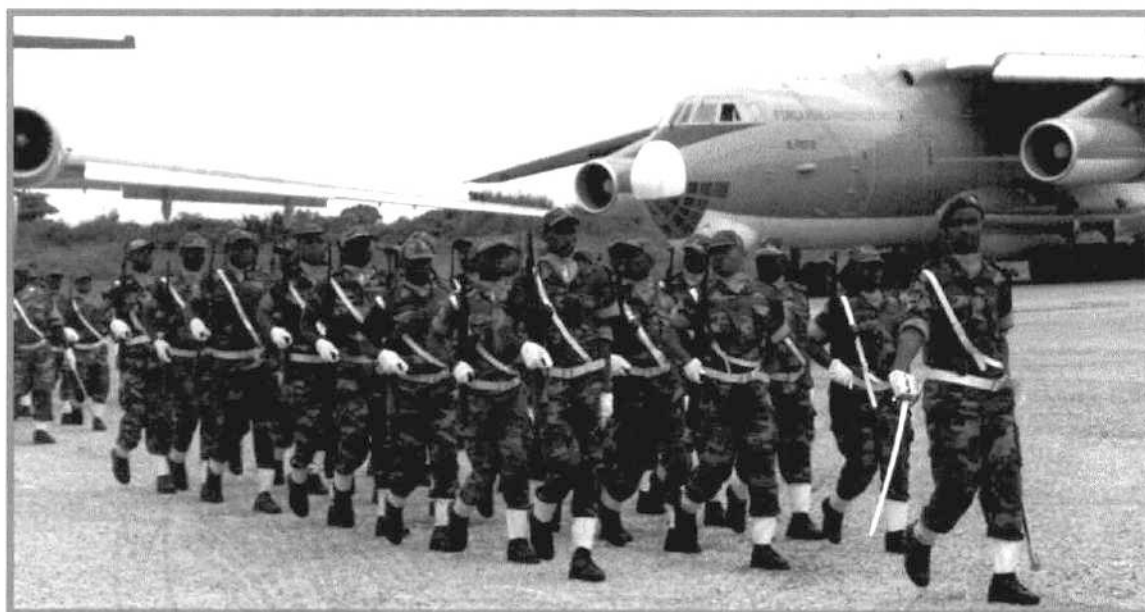
EFFECTIVOS DA FANA

O Subsistema da Marinha de Guerra comporta: Academia Naval da MGA; Instituto Superior da MGA; Escola de Tecnologias Navais; Escola de Fuzileiros Navais;