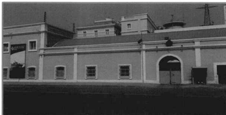
COMANDO DA MGA

Cumprir missões de natureza diplomática.