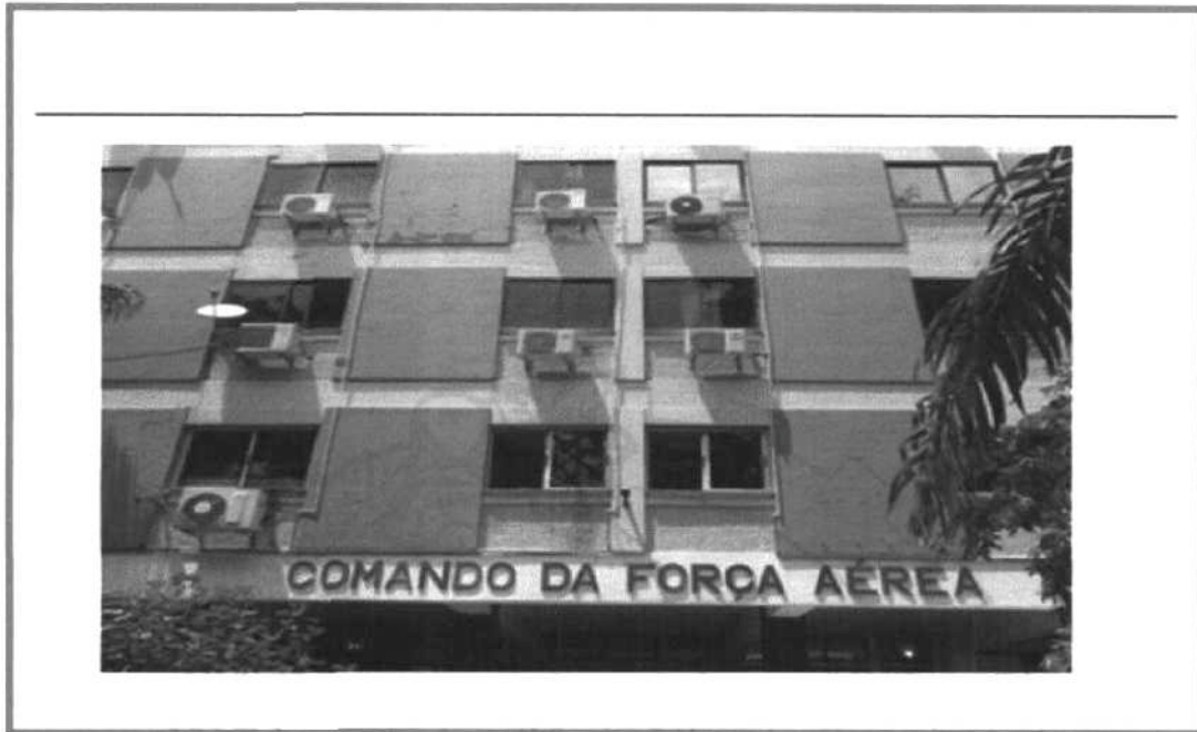
COMANDO DA FAN