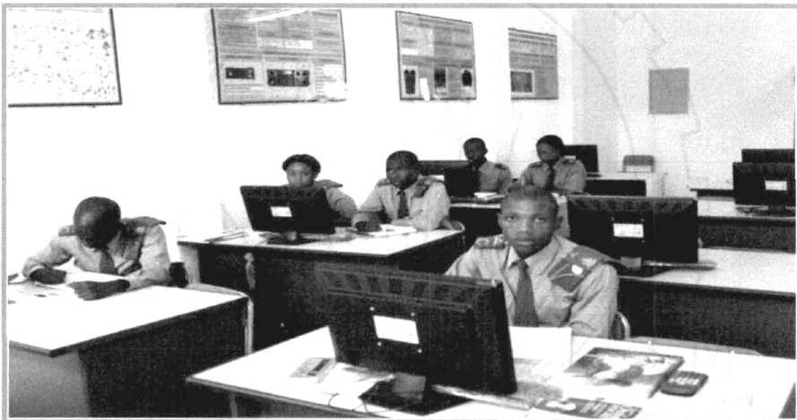
CADETES EM AULA

O Subsistema da Força Aérea comporta: Academia Militar da FAN; Instituto Superior da FAN; Escola Militar de Aeronáutica; Escola das Armas e Serviços da FAN;