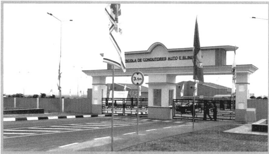
ESCOLA DE CONDUTORES AUTO